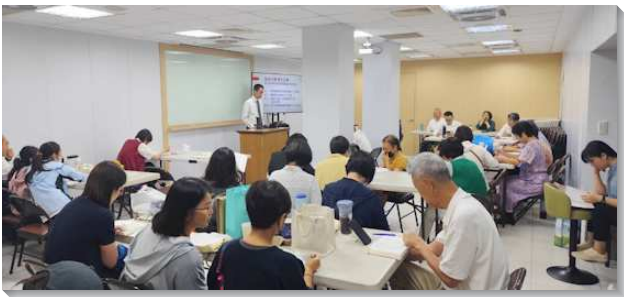
▲聖徒們追求新約聖經裝備真理

——十三會所領受聖徒普遍追求真理的負擔，規劃『半年追求新約聖經一遍』，盼望藉著規律且有系統的讀經生活，幫助聖徒建立天天讀經、研讀真理的習慣。本次追求自四月十二日開始，每主日下午一點至三點於會所集中追求，歷時二十六週，豫計完成新約二十七卷的讀經進度。為使聖徒更深入聖經內容，會所鼓勵聖徒在週間先完成當週進度，並於小排聚會中分享亮光與享受，再於主日下午集中追求。