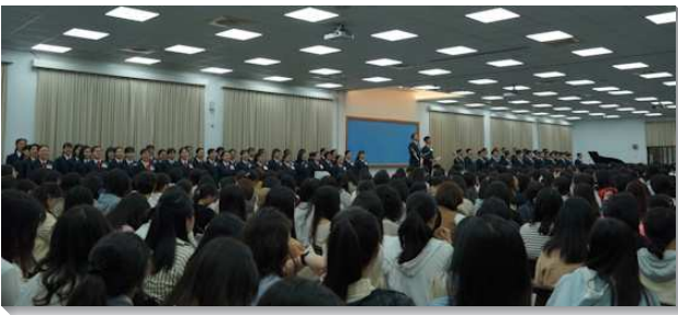
▲全時間訓練秋季班呼召聚會在三會所舉行

本次呼召聚會的主題為『得勝者的勝利』，以但以理書為背景，描繪在神子民被擄，神的見證遭破壞的黑暗時代，仍有一班青年人，就是但以理和他的同伴們，願意立定心意，為神的權益站住。他們是得勝者，絕對與神是一，勝過撒但一切的詭計與欺騙；他們勝過屬鬼的飲食，拒絕善惡知識樹所代表獨立於神的生活，反而揀選生命樹所表徵的神自己作生命和供應，使他們在生命裏與神聯結並成爲一。他們也勝過