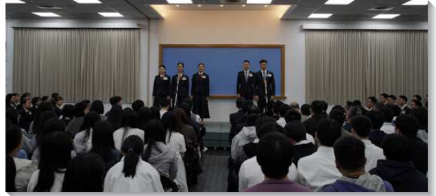
▲全時間訓練學員分享參訓見證

聚會中，訓練學員見證他們如何蒙主呼召。一位姊妹見證，參訓前，雖知道需要受訓練，卻有更多不想參訓的理由，總想等心志再剛強一點、身體狀況再好一點，尤其想再多享受婚後得來不易的安穩。然而，藉著一位同伴突然被主接去，主使她看見：主必快來，不要以為總有時間傾倒香膏，於是她便放下自己的抓奪，和原本許多對前途和規劃的考量，與弟兄一同抓住機會，參加訓練。另一位姊妹也見證，在進訓