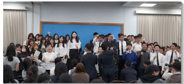
▲青年人答應呼召參加訓練

會後有大專聖徒分享，很被學員蒙召參訓的見證所感動，看見許多人雖面臨家庭、前途、工作等難處，仍然願意答應主的呼召，這班奉獻的人並非沒有掙扎，乃是在環境中仍願揀選神和祂的經綸。也有青職弟兄分享，看見許多夫妻一同參訓，使他興起羨慕，