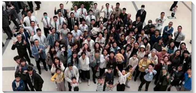
▲聖徒們參加神命定之路成全訓練

此次三天兩夜的訓練，共有七篇信息。第一、二篇著重交通實行神命定之路，指出需先領受異象，藉實行新路，被構成為主所要的新婦，帶進主的再來。因此需要心思更新，建立正確價值觀，過攻勢的召會生活。第三、四篇強調生態的建立。弟兄以養魚為例，說明魚需良好的生態環境—潔淨的水質、健康的水草與充足的養分，纔能存活並繁衍。同樣，召會生活也