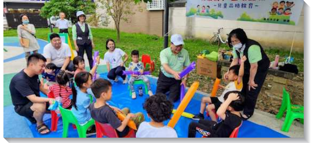
▲學員與聖徒在公園兒童排接觸人

東部與離島方面，花蓮聖徒長期深耕福音，有弟兄打開自己的小吃店，每週免費愛筵接待學生，此次帶進六位國中受浸。另有一位八十四歲長者因喪偶悲傷多