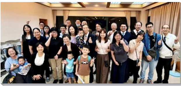
▲聖徒們喜樂聚集相調

藉著弟兄姊妹們在愛裏的同心邀約，許多久未聚會的青職與青壯聖徒紛紛重回神家，甚至有多位曾在本