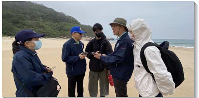
▲學員與聖徒在馬祖海邊傳福音

弟兄勉勵學員，要在主的愛裏，過愛的人生，全心愛神、愛人，寶愛人的靈魂，在愛中餵養並顧惜聖徒。因神就是愛，祂要在祂拔高的愛裏將我們作成祂的複製，