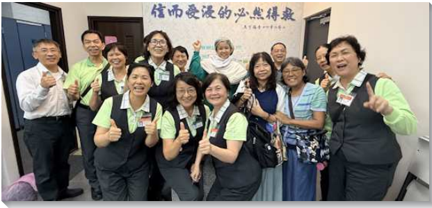
▲學員在台中北屯傳福音帶人受浸

學員此次蒙恩的關鍵，在於同心合意的配搭與隨時隨地不住的禱告。開展前每位學員在主面前更新奉獻，讓聖靈掌權。許多開展地隊伍在出發前及過程中在主前禁食、屈膝禱告，祈求主為福音開路。因此這不僅是一次外在行動，更是每位學員屬靈生命的深刻經歷。