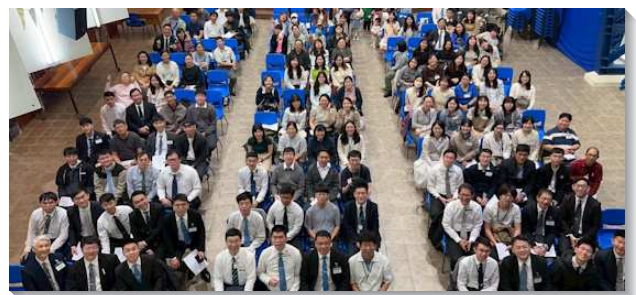
▲聖徒們參加大安區青職特會

第二，特會由大區各會所青職聯絡人規劃並服事。除了實際拿起各項事務的服事規劃，也幫助總管們對聖徒