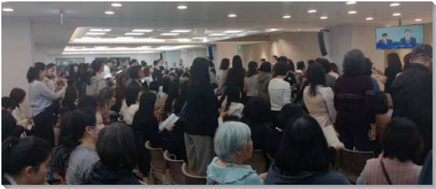
▲青少年服事者事奉相調聚會

信息一開始就提到青少年的特性與現況，年輕人可塑性極高，很可造就，但也容易受這世代的影響，需要用智慧去引導、鼓勵。青少年服事者是很好的『橋樑』，銜接兒童與大學的服事，擔任父母與兒女的溝通與協調的角色。服事者更要認識成全人完全是在於自己讓主成全了多少，而能根據被成全的經歷，去成全別人。青少