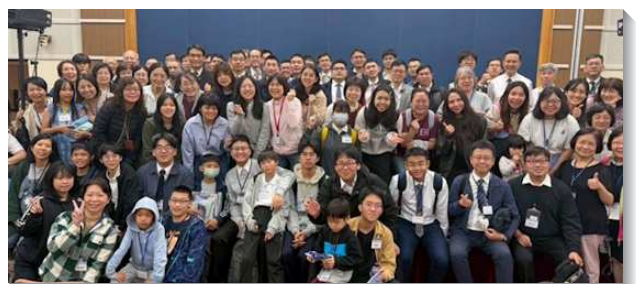
▲聖徒們參加神命定之路成全訓練

在實行上，我們操練『活、調、開、動』，特別是從建立兒童排開始，帶進雙向得人。當每個家都成為生命、真理與福音的站口，實行生、養、教、建，必能帶下繁增之福。願我們同心合意實行命定之路，使召會得著生機的建造！（高子豪）