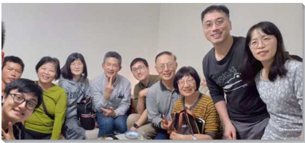
▲聖徒們同心合意開家開排

十八會所看重當前召會生活中建造小排的重要負擔，以及如何得著並穩定牧養青年人。於去年七月，重新開始週五晚間的小排聚集。起初是幾位中壯年弟兄聚在一起，在主的帶領下，經過一段時間的操練與學習，人數逐漸穩定。目前約有五至八位弟兄姊妹固定參與，並有四個家庭輪流開家，彼此配搭、彼此扶持，使聚會越來越有活力，更顯出身體的實際。