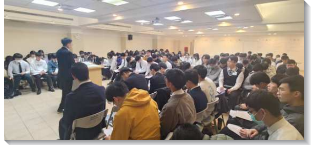
▲大安區大學聖徒期初特會

第二篇延續第一篇的負擔，看見我們是枝子的事實，更要問自己是否有住在主裏面？是否維持與主的交通？在我們與主之間是否有絕緣體，使我們與主之間產生間隔與爭執。約翰十五章三節主說，『因我講給你們的話，已經乾淨了。』這乃是雷瑪的話，能修剪我們並除