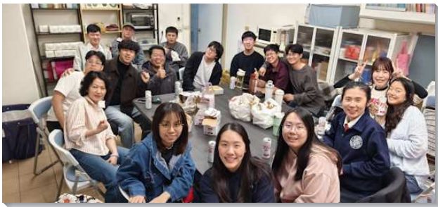
▲聖徒們與大專學生配搭校園排

聖徒們也把握年節期間，前往台島各鄉鎮探望返鄉聖徒、新人和小羊，並接觸其未得救的家人。有別於