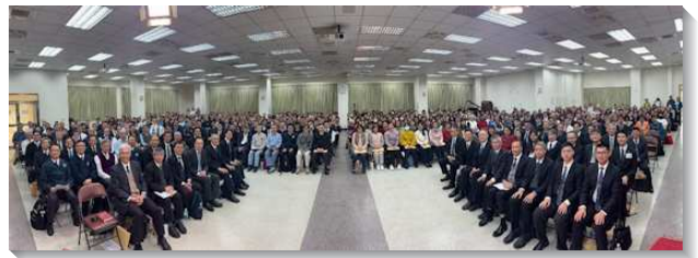
▲得榮少年關懷者事奉相調北部場

在實行上，上午場聚會強調結常存的果子與送會到家的負擔。弟兄題醒關懷者們，不能僅滿足於申請前完成八次生命教育課程，以及每月一次探訪的要求，更要藉著以週為單位的家聚會和召會生活，將主的話與靈供應給青少年。透過送會到家，增加接觸得少父母與長輩的頻率，達到『得一人，得一家』的果效。讓這些少年不僅得救，更能進入排生活，成為基督身體上活而盡功用的肢體。下午場聚會強調『得少在主日聚會中被成全』與『得少在青少年特會中被成全』的負擔，盼各地的服事，要將得少看成神家中的孩子，對他們有『質』的成