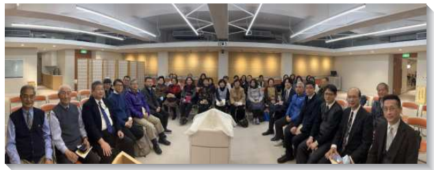
▲聖徒們積極過召會生活

今年二月份國際華語相調特會期間，本會所接待了來自北美 San Francisco、San Jose、Atlanta 等地召會的