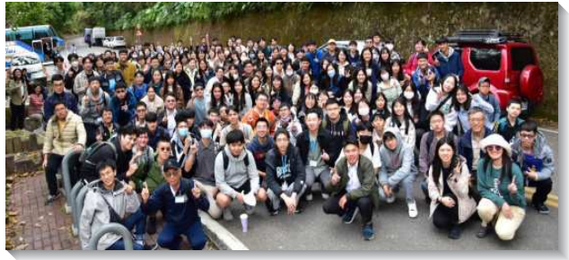
▲大學生們參加春季期初特會

第三篇則交通到，藉著神向摩西顯現的三個神蹟，使我們認識撒但、肉體、世界而蒙神呼召以事奉神。積極一面，成為拚上一切，絕對為著主恢復擴增的人，好使我們能結常存的果子，帶進召會的擴增與建造。