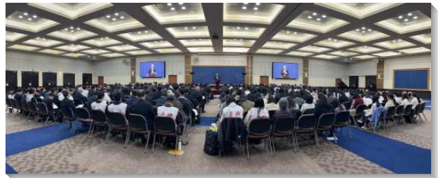
▲各地同工們參加同工訓練

第五篇『照著神的心和旨意禱告而事奉神』說到，神要得著人的意志與祂合起來，與祂是一，好叫人在禱告中彰顯並響應祂的旨意，為著祂的喜悅。亞伯拉罕是我們的榜樣。他活在與神親密的交通中，成為神的朋友，耶和華就作為基督，在人的形狀裏，帶著人的身體，向他顯現，並在人的水平上與他來往。