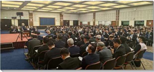
▲春季全台同工訓練在中部相調中心舉行

第一篇信息是『帶著異象照著啟示而事奉』，說到我們事奉神，必須有異象並照著啟示。因為屬天的異象會管制我們，限制我們，支配我們，指引我們，保守我們，徹底改變我們，使我們持守在真正的一裏，並給我們膽量一直往前。