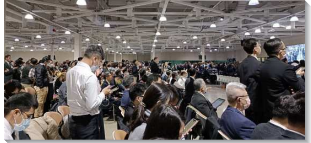
▲ 各地聖徒至美國安那翰參加冬季訓練

第七到第九篇信息，則是從尼希米記說到三個重要的方面—榜樣、建造與爭戰。尼希米是一個對神有時代價值之人的榜樣，是神要轉換時代所要得著的時代憑藉。我們該以尼希米為榜樣而積極進取，使神能得著男孩子，以引進國度時代。此外，我們也需要內在的跟隨尼希米的榜樣『建造城牆』，就是建造召會作神的國，使召會作為神的家，祂的居所，得著保護。在建造城牆的過程中，面對仇敵的發怒與圖謀，與尼希米一同作工建造的以色列人，一手作工建造，一手拿兵器爭戰。這啟示每當我們在神的建造上勞苦時，必然會有爭戰。因此，現今為著召會的建造，我們需