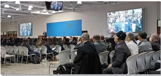
▲ 冬季訓練在美國安那翰水流職事站園區舉行

本次結晶讀經內容豐富、拔高，不僅富有神經綸的啟示，同時也完成了新約、舊約結晶讀經的追求，極具歷史意義。第一與第二篇信息是從歷代志說明神在人歷史中的行動，要為神豫備道路以完成祂永遠的經綸；以及從巴比倫被擄歸回的聖民，如何在美地上生活。緊接著的四篇信息，是從以斯拉記說明被擄歸回的人如何配合神殿的重建。在第一次被擄歸回耶路撒冷後，他們乃是先重建神的壇—燔祭壇，使他們的生