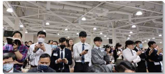
▲ 聖徒於冬季訓練聚會中唱詩歌

第十篇與第十一篇信息，則是將以斯拉記與尼希米記擺在一起，為我們陳明兩顆重大的結晶。其一，在主恢復裏的領導，乃是神所賜神永遠經綸之異象的領導。尼希米知道他需要求助於精通神話語的以斯拉，纔能使神的百姓被重新構成為神的見證與彰顯。這不僅豫表神在今天所要得著的召會該如何彰顯神，也給我們看見我們需要在身體裏相調著同作奴僕事奉。其二，是從活出並作出新耶路撒冷的異象，來看以斯拉職事之『潔淨』、『教育』、『重構』與尼希米領導之『分別』、『保護』、『彰顯』的內在意義；並且將其應用於經歷，使我們的生活與事奉能活出並作出新耶路撒冷。