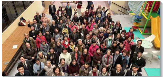
▲城中大同區秋季週中成全聚會在一會所舉行

第二個蒙恩是召會生活－神命定之路實行上的蒙恩。本堂課主要以牧養材料第一系列－高品福音為教材。課堂上以互動、示範和實際操練的方式讓聖徒們