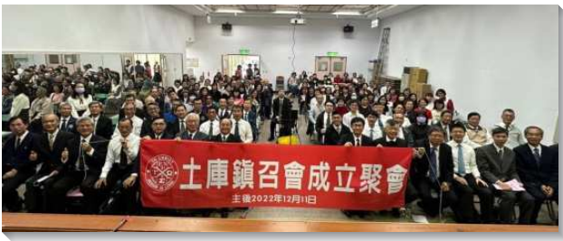
▲土庫鎮召會於二〇二二年十二月十一日成立

聚集當天先有擘餅聚會，接著是土庫鎮召會聖徒的展覽見證，並播放回顧影片，一同數算主在當地恩典的軌跡。在一九八九年初到九三年底『五年福音化台灣』的