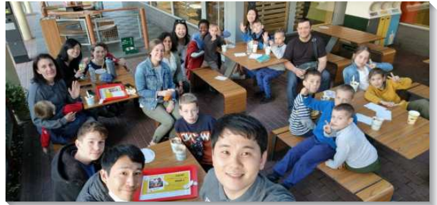
▲聖徒們至東歐傳福音配搭服事兒童

聖徒們租一個離中央車站不遠的旅館餐廳傳福音，來了四十至五十位福音朋友，加上一群可愛的小朋友。整場聚會大家都認真聆聽信息，弟兄用約翰福音第八章犯罪的婦人為福音內容，說到人最大的問題。人不能解決罪，只有主這位沒有罪的，能赦免人的罪，解決人罪的問題，並且能賜給人脫離罪的生命。當場有許多人都敞開禱告，接受主作救主和生命。同