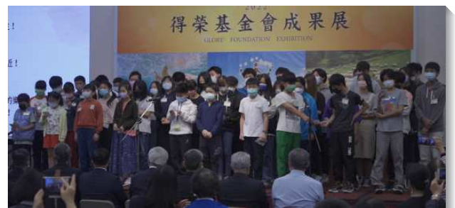
▲各地召會藉得榮少年專案關懷青少年

接著是快樂學習成果影片，得榮和恩慈基金會合作開辦課程，今年兩學期共有一百三十八位學生、四十四位關懷者與家長報名。期盼繼續藉著自由搏擊班、創意黏土班、趣味魔術班，讓青少年找回主動學習的熱忱。