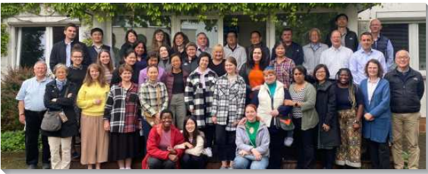
▲各地聖徒配搭至東歐傳福音

在本次的福音行動中，有一位海外聖徒在華沙租了一間房子，有四個房間，除了用來住宿外，更是成為聖徒邀約敞開之福音朋友的地方，每天傍晚平均都有二十個不同人位配搭。我們為福音朋友禱告，每天都有三至六位應邀前來。聖徒們分享他們對主的經歷，