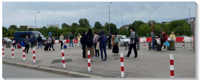
▲聖徒們至東歐一同配搭傳福音

在一個週一的時間，弟兄們希望我們配搭牧養從烏克蘭來的弟兄姊妹們，所以當天就安排了二個家聚會。第一個家聚會是和二個從尼古拉耶夫出來的家，聽他們得救的見證。一位弟兄是在一九九六年，因讀到職事的書報而認識主的恢復，就在那時從基督徒團體出來，開始在該城過召會生活。他們不僅顧到當地