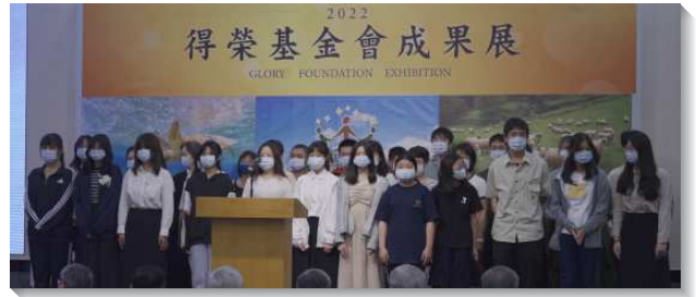
▲各地得榮少年展覽見證

雲嘉地區照顧者交通，得榮少年專案對於鄉鎮的福音開展，是非常好的管道。得榮少年的來源有的從學