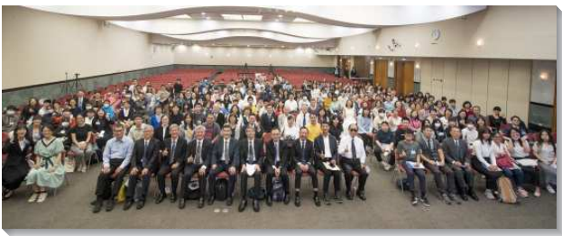
▲得榮基金會成果展於信基大樓舉行

台北大區，一位八十四歲高齡的關懷者和他壯年班的同伴，以得榮少年教育專案為憑藉，不辭辛勞，從台北遠至宜蘭南澳鄉照顧得榮少年，最終帶領少年全家三代得救。新北大區一位疾病纏身的母親，攜三名稚齡兒女分享，她的大兒子成為得榮少年之後信主得救，透過關懷者的關心，她也信主受浸。因著有主有弟兄姊妹，她的心開朗了，孩子的心也不再抑鬱。