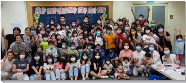
▲ 聖徒們配搭暑期兒童生命成長園

十一會所於八月一日至五日與八十八、四十九會所聯合舉辦五天的暑期兒童生命成長園。這個行動源起於十四年前大家同屬十一會所時，一群服事兒童排的弟兄姊妹有感所接觸的福音朋友，到了暑假就參加許多夏令營，而漸漸失去對主的渴慕，於是我們開始舉辦生命成長園，再銜接台北市召會的親子健康生活園，讓孩子藉著性格的操練留在召會生活中，得著生命的牧養和培植。今年有三十八位兒童報名，每日大約有三十位弟兄姊妹配搭這個身體的行動，有上班