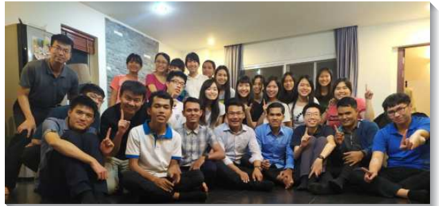
▲大專生至柬埔寨相調訪問

在柬一年後，我在開展上碰著瓶頸：一面，我與姊妹在語言上得以與聖徒有簡單的溝通，並喜樂的與聖徒相調；然另一面，卻覺得召會繁殖擴增的情形並不顯著，缺乏開展的施力點。當時，因著東北開展的蒙