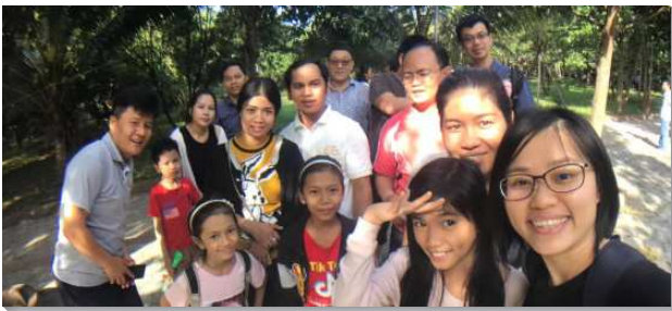
▲聖徒們一同配搭傳福音

記憶猶新，在我們家剛到柬埔寨的第二天下午，我就和姊妹帶著未滿一歲的女兒，前去全柬第一學府—金邊皇家大學，接觸當地學生。當時，我們尚不能用