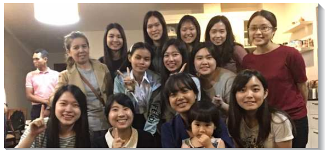
▲大專生至柬埔寨相調傳福音

在週間時，我們或去聖徒家中，或至會所與當地全時間者交通禱告。每個主日早上，我和姊妹架起平板，開始與聖徒線上聚集。看到遠在外省，或因疫情困在家中的新人陸續上線，心中真是喜樂。同時，爲顧到網路不佳、或不會使用網路的年長聖徒，我們用手機撥打電話，盼望沒有一位聖徒因著疫情失落。一場聚會下來，常需於同一時間使用三到四個電子設備，包括手機、平板、和翻譯軟件使話語更加釋放，看到一個個聖徒上線