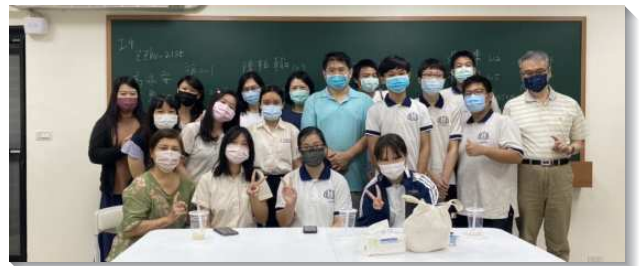
▲ 聖徒與學生配搭中正高中校園福音

位學生加上四位服事者參與。小排中的詩歌、信息皆由學生們主體服事。這使每位參與的學生對自己的聚集有負擔，也主動邀約同學來參加。在聚集中，每位學生們都操練開口讚美主，並向同伴及服事者分享近期在校園中的享受或遭遇的為難，也一同為福音朋友們禱告。