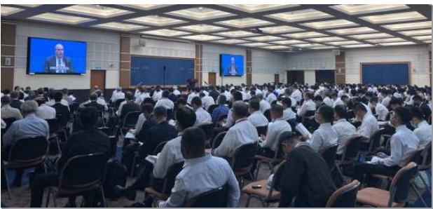
▲夏季訓練禱研背講聚會在中部相調中心舉行

第二篇及第三篇關於以利亞及以利沙的豫表。第二篇為『藉著緊緊跟隨那有時代異象的時代執事，而進入時代的職事—四段要緊的路程』。是用以利沙跟隨以利亞四段要緊的路程，來表明我們若要進入新約時代的職事，就必須照著時代的異象，跟隨時代的執事。