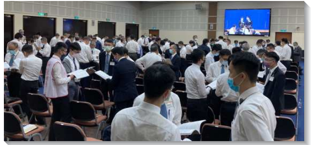
▲聖徒們於夏季訓練中分組禱研背講

第六篇至九篇皆與聖殿有關。第六篇說出神渴望帶領我們從帳幕的召會生活往前到殿的召會生活。第六篇說