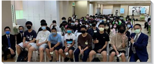
▲得榮基金會得榮少年獎助學金頒發聚會

十五位聖徒與會。弟兄分享親身經歷，鼓勵青少年不要受外面環境的限制，要積極的受教育，並要更努力在學業上精進，在社會上成為有用的人，並能認識生命的意義，活出有意義的人生。會後有兩人受浸得救。