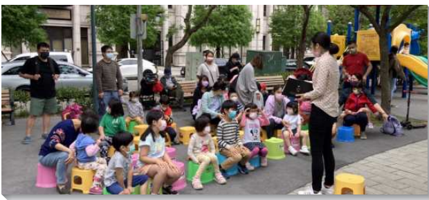
▲學員們與新竹聖徒們配搭週六公園兒童福音

在主豐富的祝福之下，五週以來共有二百三十八人相信受浸，七百六十人有分家聚會，第五週帶人參加主日達一百六十五位（主日繁增百分之二十五），最後增出了四個排與二個區。雖在疫情影響之下，每週仍有一百八十二位聖徒一同出外接觸人，佔學員所在小區主日基數的百分之二十八，使基督身體的實際更多彰顯。以下是幾處開展隊的蒙恩報導：