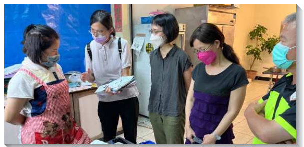
▲學員與聖徒們配搭出外訪人傳福音

桃園隊藉與聖徒敞開交通，成為活力伴，得著大量的名單。如果約到有人可以家聚會，立即與聖徒們交通，一起有爭戰的禱告，配搭聯結緊密，探訪福音家庭時，將基督供應給人。因著週週實行活力排，更多