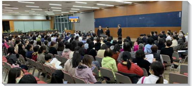
▲得榮基金會在新北說明得榮少年教育專案

基金會服事的弟兄們，深覺這是一條能直接幫助並接觸青少年和他們家庭的路，於是決議將這專案配合全台青少年工作，擴展至全台各地。今年三月共四個週六，基金會服事者配合全台青少年工作者，分批在台南、嘉義、台中、新竹、花蓮、桃園、南投、高雄、台北、新北等地，共舉辦了十場說明會，約一千零八十人與會，另有四百三十六人參加線上說明會，合計一千五百一十六人。基金會也印製了五千份簡介，提供各地關懷者拜