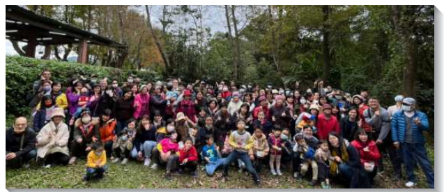
▲聖徒們建立活力生活照顧小組出外相調

因此本會所的弟兄們緊緊跟隨帶領，利用集中禱告聚會及週六晨興追求聚會，積極推動『生活照顧小組』的建立，鼓勵每個小區儘快成立編組，彼此觀摩學習。在編組過程中，若有為難都可以提出來研討交通。全會所並舉辦至文山農場與陽明山的戶外實體相調，加強聖徒們的信心。