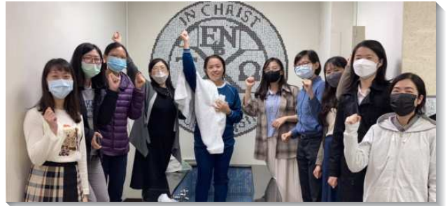
▲學員與聖徒們配搭在福音聚會結果子

台東延平隊每週六中午禁食，為熟門、生門提名代禱。學員和聖徒一同走訪，逐戶邀約人參加主日聚