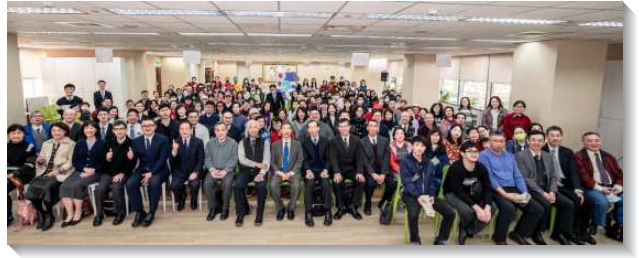
▲八十六會所於二〇二一年十二月十九日成立

會中弟兄交通：我們今日正在寫召會的歷史，因二千年歷史中從未有如台北市召會，雖有四萬多位聖徒分在許多會所卻只有一個見證。一地一會的召會立場，約束我們持守這一的見證。林弟兄交通：自一九二二年福州召會開始至今一百年，主的恢復影響了全世界一百二十個國家，因我們以聖經為獨一無二的標