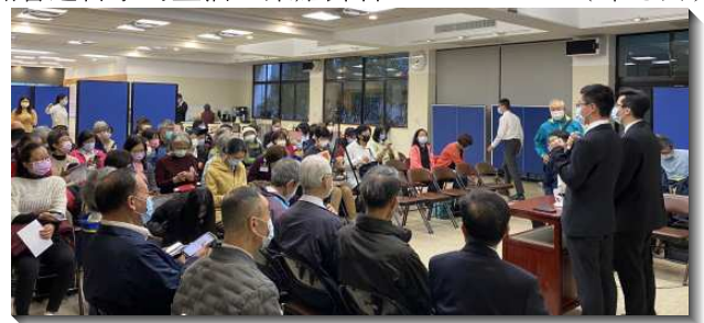
▲聖徒們參加週中成全一同蒙恩

感謝主，在疫情的環境下，仍使聖徒們得享豐富的成全課程及喜樂的相調行程。願主繼續祝福祂的召會，使更多聖徒得以看見神聖啓示的高峰，並過一種照著這啓示的生活，榮耀歸神。（陳恩典）