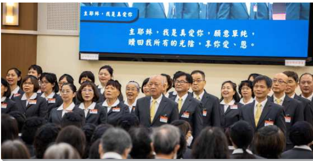
▲壯年班暨延伸訓練畢業學員展覽詩歌

接著是畢業生蒙恩見證。第一組學員見證他們藉著訓練，得著變化與成全，作主貴重的器皿。第一位弟兄說，壯年班規律的生活，使他操練憑靈活著，憑靈而行，翻轉老舊的召會生活與服事。第二位姊妹見證，訓練使她學習將心思置於靈，成為應對各樣環境的祕訣。第三位姊妹見證，她以前的召會生活好像例行公事，但