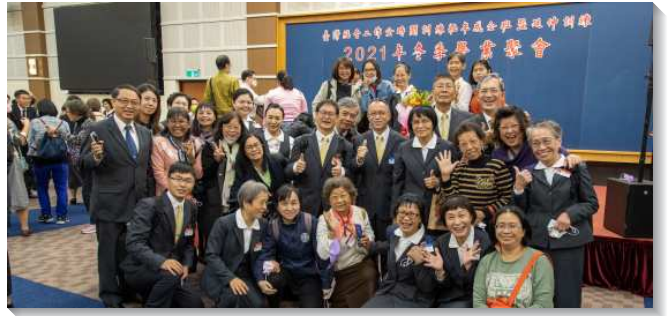
▲聖徒們參加壯年班暨延伸訓練冬季畢業聚會

在學員齊唱第二首詩歌『奮力活動與神是一』之後，第二組畢業學員分享他們的見證。第一位弟兄見證，他在福音開展中經歷基督身體的得勝，願照著這榮耀異象，畢業後繼續與眾聖徒一同開展神的國度。第二位姊妹交通，她在訓練中學習順從身體的頭，配搭事奉，今後願意照著所經歷的，操練作筋作節，建造基督的身