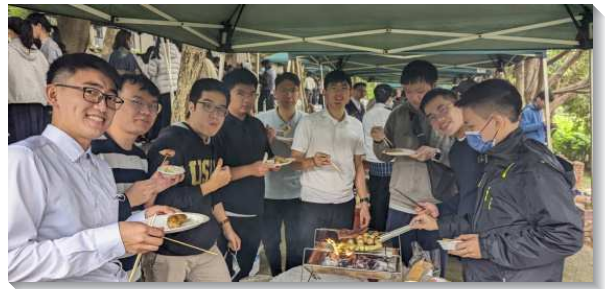
▲畢業生特會中安排烤肉相調

整體而言，此次特會讓學生們看見許多信心的榜樣，亦讓不同校園的弟兄姊妹有活力相調的機會，從彼此的分享中得著激勵；另一面也藉著服事者的交