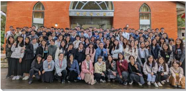
▲大學聖徒參加畢業生特會

第一篇信息交通到『一個最榮耀的人生』，為整場特會奠定良好的基礎，弟兄以親身事奉主的經歷，使學生們得著激勵，裏面的異象也再次被拔高，看見值此時刻，主需要在地上得著一班為祂活著的青年人，無論他們身在何處，是何種身分，都可以是全時間事奉主的人。