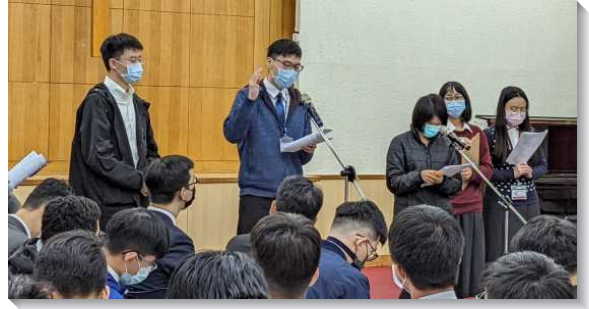
▲大學聖徒於畢業生特會中分享

除了五篇信息外，此次特會亦安排長時間禱告的行程，盼望學生們不僅聽過這些信息，更能將這些話帶到禱告裏，尋求從主而來的亮光和引導，聽見主親自的呼召，願意更新奉獻，把自己的前途交在主的手中。弟兄們幫助學生認識，禱告的目的，並非尋找正確答案，而是讓三一神得著更多的空間和地位，好將祂自己作到我們裏面。學生們也見證在禱告的過程中，藉著享受與主親密的交通，接受主的光照，並照著主的引導在主面前有清理與奉獻後，與主的關係更