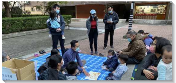
▲聖徒們配搭公園兒童排

排。各年齡層的聖徒們都喜樂的一同配搭。剛開始的幾週，許多孩子因爲遠遠聽見聖徒們唱詩歌的聲音而受吸引，從旁邊的遊樂區逐漸移動到我們這邊，一同唱詩、聽故事、背經。有的家長覺得這樣的兒童活動很好而加進線上群組，也有家長連續帶著孩子參加。