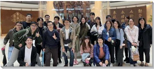
▲青職聖徒們出外相調交通

十五會所青職聖徒們於九月十九日至二十一日參加一連三天的北市青職特會。今年各大區的會所均以實體及線上併行的方式舉行，因著這樣的聚會方式，本會所報名人數比往年都還要多，共二十位聖徒參加。眾人一同享受這六篇的信息—『進入主構上時代的恢復，傳承主榮耀的託付，帶進主再來的復興』。與會的聖徒個個都被主的話語和啓示充滿，靈裏火熱，在會後的奉獻宣告裏，青職排的聖徒們宣告，在要來的一年