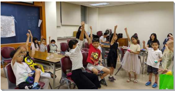
▲城中大同區親子健康生活園

城 中大同區共十六個會所，於七月四日至八月二十一日共七週，舉辦暑期親子健康生活園，性格操練主題為『剛、柔、順』。因應疫情全程在線上進行，總人數比去年實體聚會多了二十九位家長和兒童，總計家長和孩童有三百零五位。以往較少為著學齡前的兒童有實體的暑期行動，今年他們也能一同參與。因著改為線上聚會，有電腦操作的需要，讓更多青年人能一