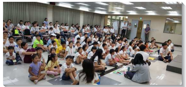
▲南港內湖區親子健康生活園

在最後一天的線上展覽聚會裏，看到小朋友一位位的展覽詩歌，熟練的背誦『剛、柔、順』的性格要點，配搭的聖徒真覺得已過幾週家長們的勞苦都是值