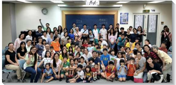
▲聖徒們一同服事兒童生命成長園

緊接著八月有親子健康生活園之家庭時光。行動結束後，有人捨不得下線，有人覺得時間過得太快，有人一