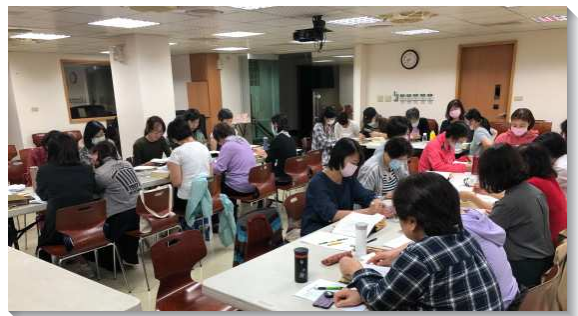
▲姊妹們一同追求真理被主的話構成

這樣的操練，使眾人都進入了吃乾糧的階段，不再以天然人的觀點來讀聖經，而專一定準於神的經綸。同時，藉著分組帶讀經，每位姊妹都有講說真理的機會，實際的被真理構成，一週過一週，我們享受姊妹們裏面豐富的基督，經歷在光中同得所分給眾聖徒的分。