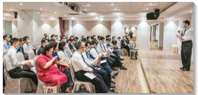
▲全台大學院校教職員聖徒分組研討

在職員組（含照顧家）中，藉著各地聖徒分享的見證及相關議題的討論，加強眾人在校園服事的心志及異象。有照顧家分享開家的蒙恩，有時因工作繁忙實在無法陪伴，就將鑰匙交給學生，讓他們自己到家中聚會。有姊妹在學校宿舍服務，有機會接觸到敞開且有需要的大學生，就轉介紹給大學聖徒接觸而結果子。也有在單單位工作的姊妹們，相約一起為著校園工作禱告。有姊妹輔導學生社團，主動鼓勵學生聖徒使用校方資源，以成為校園的見證。這些分享都使聖徒們得著鼓勵及加力。