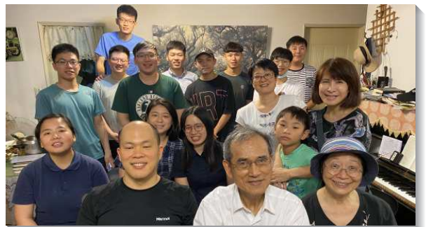
▲聖徒們開家配搭傳福音

感謝主，在召會中聖徒配搭和諧，不論飯食、話語、代禱、整潔，聖徒們主動抓住機會盡生機功用，願主祝福，將得救的人加給祂的召會！（陳纘華、毛鈞平）