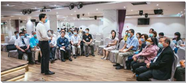
▲全台大學院校教職員聖徒分組交通

本次相調聚會著重分組研討。聖徒們分成教員組、職員組（含照顧家）以及博士後組（含研究生），交通。在教員組中，有剛退休的弟兄交通他在教職生涯中享受召會生活並得裝備，被成全在大學校園作得人的漁夫，並擔任行政與服務的工作，榮神益人。之後，教員聖徒，再分成就『研究與升等』及『教學與行政』，二組交通。