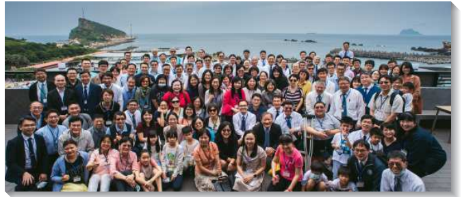
▲全台大學院校教職員聖徒相調聚會在野柳舉行

在『教學與行政』組中，聖徒們見證，教學是接觸學生的管道，教師聖徒常要思考如何關心學生的需要，尋求機會幫助學生認識神。而行政工作是得成全並盡功用的機會，聖徒所以能被校方看重並驗中，除了工作能力以外，更重要的是聖徒們的存心純潔，在工作中認真付