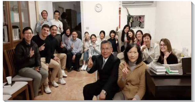
▲學員們在希臘與聖徒配搭傳福音

印度隊分為古岡與德拉敦兩隊。今年的開展不同以往在馬路上接觸人的方式，改以叩門為主要方向，深入印度的社區，將一個又一個的平安之家尋找出來。雖然主這一次帶眾人走『新路』，成效不那麼快速。但是當我們看見主在這地親自推動祂手的工作，就使我們喜樂與良人一同勞苦，並對這地滿了盼望。我們也與印度的學員及聖徒們調在一起，突破語言、文化、種族、宗教、飲食、與氣候等種種限制，經歷一