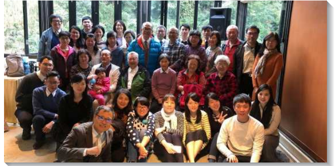
▲聖徒們參加事奉展望交通

經過三個月的操練，召會生活的空氣逐漸被翻轉，因著有這些聖徒願意走出去，使得原本以『會』為主的召