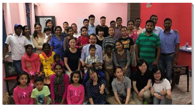
▲學員們在印度與聖徒配搭傳福音

日本隊分為六個小隊，至神戶、大阪、東京、仙台、札幌等五個城市及其週邊開展。在學員抵達日本前，日本聖徒已迫切為我們禱告。每次出發開展前，學員與聖徒們先一同禱讀，享受主話，接著為福音行動禱告。大家因著對主滿了享受，便能自然的湧流並供應生命，且喜樂洋溢，脫離作工與勞苦的感覺。我們也與日本的學員及聖徒們調在一起，在當地積極實行神命定之路，眾人一同禁食禱告，一同在馬路上傳