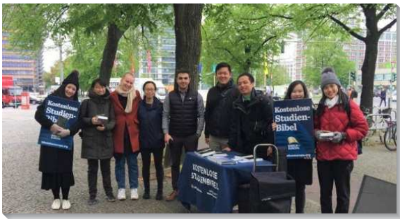
▲學員在德國校園發送德文新約恢復本聖經

德國隊分為漢堡、柏林／萊比錫、杜塞道夫、法蘭克福、斯圖加特、慕尼黑六個小隊。我們在車站及大學校園週邊，擺攤發送德文新約恢復本聖經，尋找敞開的基督徒與尋求者。除此之外，我們也到學校餐廳內接觸人，藉著與人建立關係，進而邀他們來讀聖經家聚會或是有分小排聚集，將真理的話向人解開，使人脫離宗教的觀念，得著真正生命的供應。在這五週之中，我們發送了一千八百二十六本聖經，並有九十六位福音朋友參加讀聖經的家聚會。