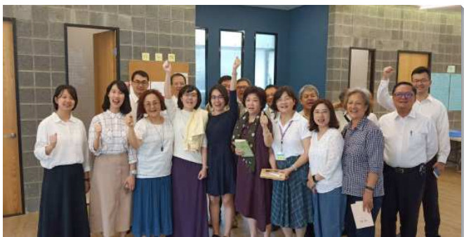
▲聖徒殷勤牧養人帶新人得救

當眾人進入民數記結晶讀經，弟兄們立刻帶領我們編組成軍並拔營起行，確定每組出訪與牧養新人的時間。至今，本會所有三十六個活力組，週週實行禱