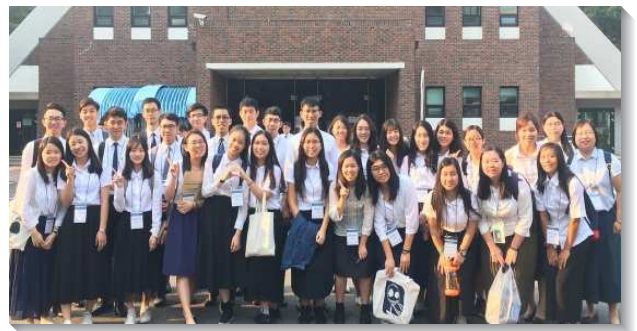
▲大學聖徒參加亞洲國際大學特會訓練

在舊約的豫表裏，禧年持續一年之久，然而我們是有福的，我們天天、時時都可以享受祂作禧年，因為禧年的應驗乃是整個新約時代，並且主耶穌就是禧年的實際。我們無論在甚麼景況中，情形是高是低，心情是好是壞，都可以、也必須到主這裏來享受禧年，叫我們得著真正的自由與安息。大多時候我們可能因著外在事物而有喜樂，其實還是虛空的虛空。惟有喫主耶穌，纔使我們得著真正的自由與安息，叫我們裏面得著滿足。