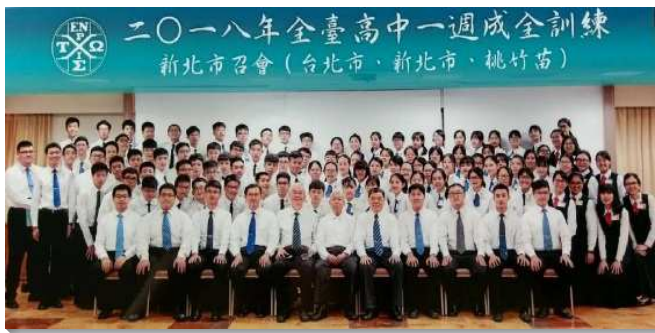
▲全台高中一週成全訓練在新北的場次

課程方面，有服事者豐富的話語供應，帶領青少年將他們裏面的恩賜、深處的靈如火挑旺起來，也帶他們在禱告中摸良心的感覺，對付內裏的罪和世界，而能逃避青年人的私慾，與同伴一同追求基督。