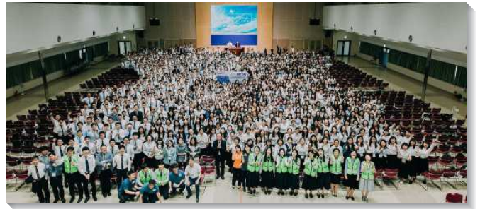
▲各國大學聖徒參加亞洲國際大學特會訓練

禧年的意思就是無憂無慮、無牽無掛、無缺無乏、無病無災，甚麼難處都沒有，甚麼都是好處；因此一切應心，萬事如意，逍遙自在，狂喜歡騰。我們必須接受主耶穌在我們裏面作真正的禧年。我們的生活應該是滿了享受主的生活，滿了喜樂和讚美的生活；當