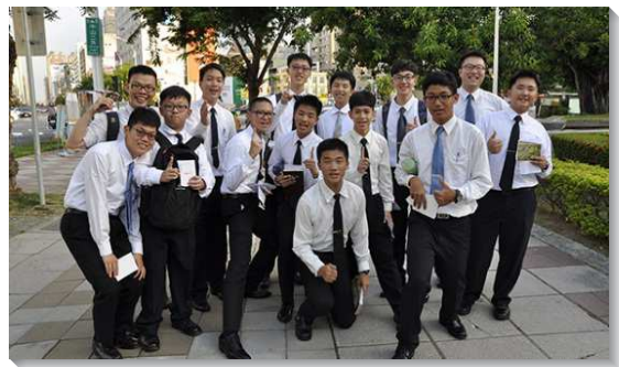
▲高中聖徒們出外傳福音

有位高中生來到訓練時，覺得只要照著平時的操練即可。然而主藉著每個晨興、午禱，每堂信息和每位同伴的靈題醒他，在主面前不只是操練，乃是要竭力拚上。主給他看見訓練裏許多竭力愛主的同伴，都是他屬靈的榜樣，他盼望日後都能持續過操練的生活。