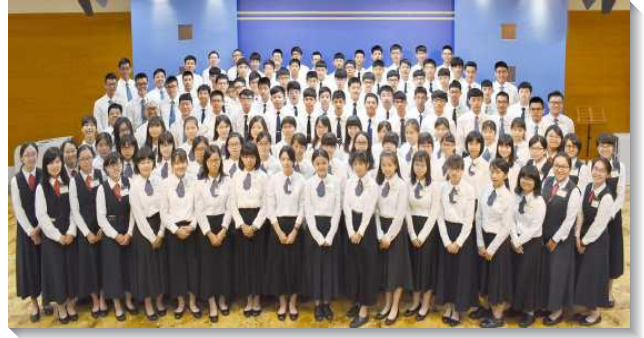
▲全台高中一週成全訓練在高雄的場次

生活方面，青少年從一起床就呼求主名，回到靈中，學習凡事在靈裏聯於主。整理個人內務及團體整潔，並在身體的交通中受調整，建立正確的性格，好托住基督。有人在這嚴格卻甜美的訓練中，在內務的實行上經歷深的破碎。有位姊妹分享，輔訓姊妹一看到她的內務很快就指出她的瑕疵，而她自己卻沒有感覺，主就光照她，原因就是沒有操練！靈的操練跟內務操練一樣，如果平時沒有操練我們的靈，我們的良心就對自己的光景沒有感覺；但若有操練靈的習慣，我們的靈就會更加敏銳。青少年們因而求主更多光照，除了在生活中有規律的性格操練，在屬靈方面也要有更多操練，使生命能越過越長大，基督更增加。