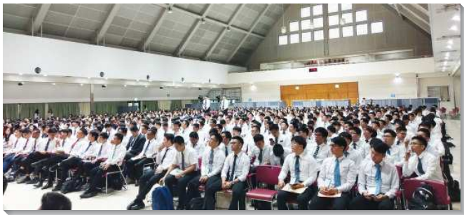
▲亞洲國際大學特會於韓國聖經真理職事中心舉行

大學聖徒突破文化和語言的限制，進入新人的交通。儘管國家不同，語言不同，但都享受同一位基督，在身體裏乃是一。學生們很寶貝能認識來自各國的聖徒，彼此珍賞並互相學習，度量被擴大且多有相調，藉著相調，顯出一個新人的實際。訓練中享受身體的豐富，聚集裏滿了靈與靈的響應，真覺得神在我們中間。