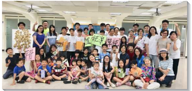
▲聖徒們一同配搭兒童品格園