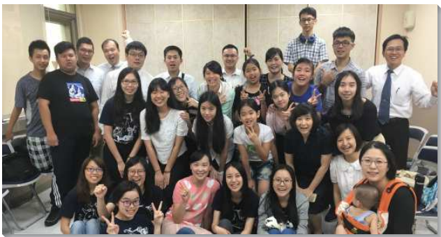
▲聖徒來訪青少年區

首先在週六上午，年輕的父母們藉著相調交通建立了親子幼幼排，近十個家，有幼兒十八位。願孩子們都蒙保守在召會中，漸漸長大，剛強起來，充滿智慧，又有神的恩在他們身上（路二40）。