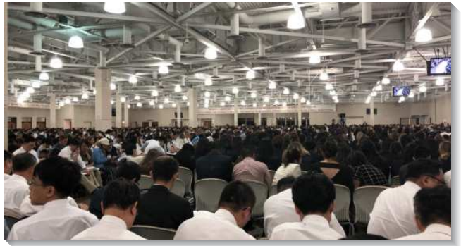
▲聖徒們參加夏季訓練，利未記結晶讀經（二）

第六篇說到『遮罪』。因著利未記十一至十五章所描繪神子民消極的光景，就有十六章遮罪的需要。在舊約裏的遮罪，豫表在新約裏的平息。作為罪人，我們需要平息，